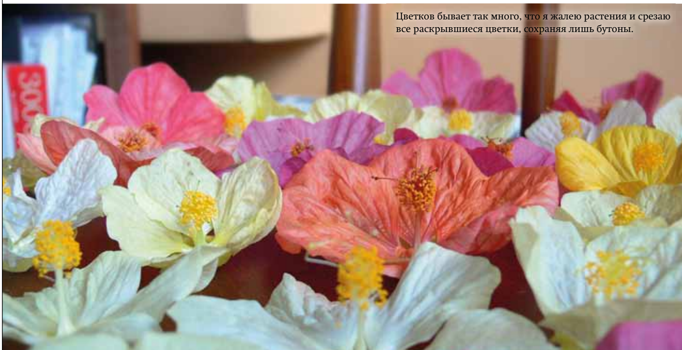
Цветков бывает так много, что я жалею растения и срезаю все раскрывшиеся цветки, сохраняя лишь бутоны.

В августе переваливаю абутилоны в тот же горшок, в котором они росли летом. Частично удаляю верхний и нижний слои почвы, добавляю свежий грунт, меняю мох, дренаж, мою и обеззараживаю горшок.